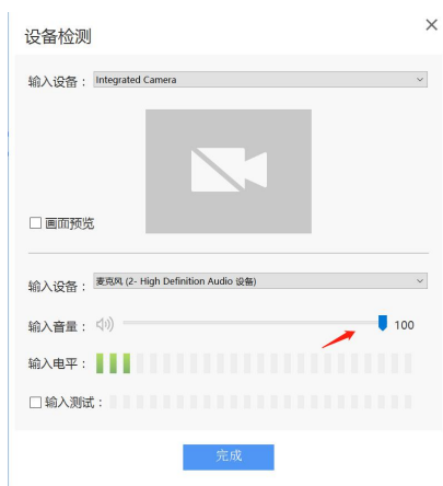
图 5 设置输入音量