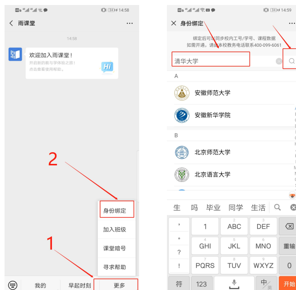
图 1 身份绑定

进入雨课堂公众号，点击菜单栏里的【更多】-【身份绑定】，进入页面后，搜索我校全称，进入我校身份绑定页面，按页面提示进行身份绑定，如图 1 所示。学生也是按此操作进行身份绑定。