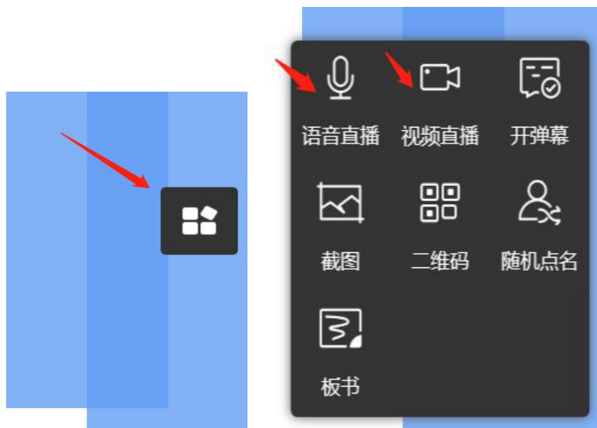
图 4 开启直播

开启授课后，点击 PPT 右端的悬浮按钮，选择开启“语音直播”或“视频直播”。 如图 4 所示。