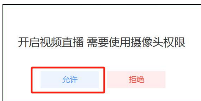
图 6 允许使用摄像头

在弹出的是否给学生发送通知的选项里，建议老师选择“立即发送”，这样学生可在微信公众号里收到直播提醒，方便学生直接从公众号信息里点击进入直播。之后直播正式开始。