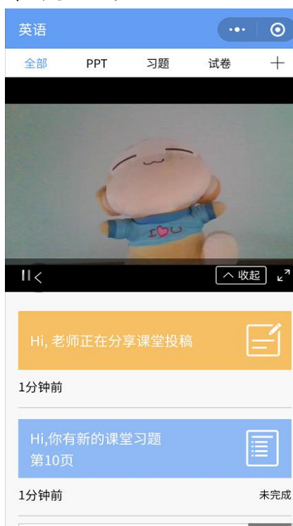
图 9 学生直播预览效果

学生端视频直播效果预览如图 9 所示,无论使用语音直播或视频直播, 远程授课可同时进行随堂测试、弹幕、投稿等课堂活动。