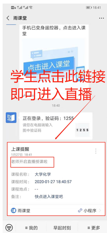
图 8 学生接收上课直播提醒

学生端视频直播效果预览如图 9 所示,无论使用语音直播或视频直播, 远程授课可同时进行随堂测试、弹幕、投稿等课堂活动。