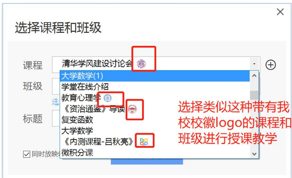
图 3 选择课程班级